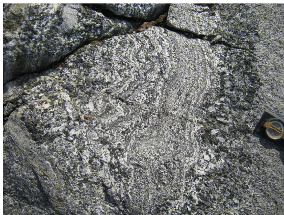
Рис. 1. Расслоенная интрамагматическая дайка в интрузии анортозитов на о. Берселот.

В восточной части о. Берселот в обнажении (S65°19,647', W64°08,567'), представляющем собой скальную стенку высотой до 7 м среди мелкозернистых анортозитов наблюдается пологозалегающая (аз. пад. ЮЗ 230°, угол 20°) интрамагматическая дайка (рис. 1). Она обнажается на протяжении 30 м и имеет мощность от 2 до 4 м. Тело дайки сложено расслоенной крупнозернистой основной породой нормальной щелочности, натриевой серии (табл. 1). Вариации в содержаниях Al_2O_3 и MgO отражают количественные соотношения плагиоклаза и амфибола в светлых и темных слоях породы. Величина пороодообразующих минералов в разных слоях закономерно варьирует от 2 x 2 мм до 7 x 7 мм.