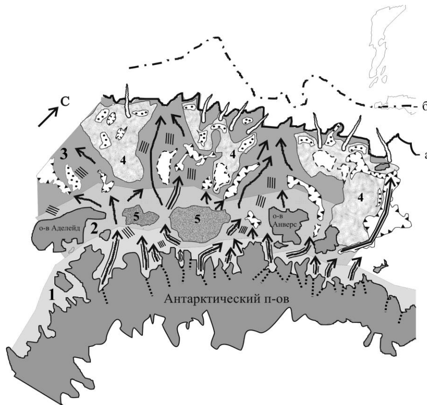
Рис. 3. Карта-схема постгляциальной морфологической структуры дна западного шельфа Антарктического полуострова.

На материковом склоне образовались ложбины, созданные суспензионными потоками, наиболее крупные из которых заложены по зонам тектонических нарушений. Со временем их форма вырабатывалась потоками, поступающими с верхних гипсометрических уровней шельфа и склона. Выделяются два крупных желоба, которые приурочены к разломным системам Анверс и Херо. Они прослеживаются до глубин 3800 м. Между ними образовались крупные холмы с превышением над дном желобов в сотни и даже тысячу метров. Обращает на себя внимание и ломаная с острыми выступами, заливами бровка шельфа.