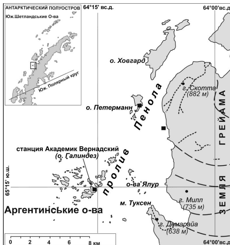
Рис. 1 Расположение колоний пингвинов дженту (черные квадраты) в районе исследований.

Район исследований расположен к западу от Антарктического полуострова (рис. 1). Высокая гидродинамическая активность в регионе (Булгаков и др., 2001) и специфические орографические условия (глубокая изрезанность береговой линии, острова и обширные мелководья) обеспечивают достаточно высокую продуктивность вод. Следствие этого – обилие криля и рыб, являющихся основным кормом пингвинов. Это обуславливает уникальность орнитофауны как в видовом отношении, так и в ее количественном развитии (табл. 1).