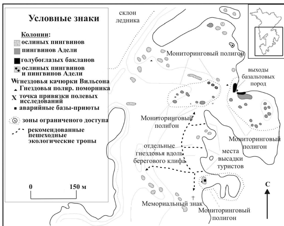
Рис. 2. Юго-восточная часть острова Петерманн, интенсивно посещаемая туристами, и зоны закрытого доступа (Naveen, 2003).

Остров Петерманн (65°10'S, 64°10'W) (рис. 2), расположенный в 6 милях севернее станции Академик Вернадский, – типичный антарктический остров с умеренно-крутым куполом ледника с наивысшей точкой 210 м и значительными по площади (примерно 1/3) непрерывными скалистыми обнажениями. Остров имеет скалистую береговую линию с многочисленными маленькими заливами. В юго-восточной части острова имеется обширная и глубокая бухта (Port Circumcision), где высаживаются туристические группы. В 2005–2006 гг. остров занял пятую позицию в списке двадцати самых посещаемых мест в Антарктике (Brief update, 2006). Доминирующим видом деятельности у туристов являются прогулки на свободных ото льда и снега участках острова с целью фото- и видеосъемки колоний гнездящихся птиц.